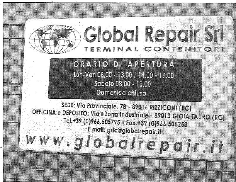
Il cartellone dell'azienda di famiglia